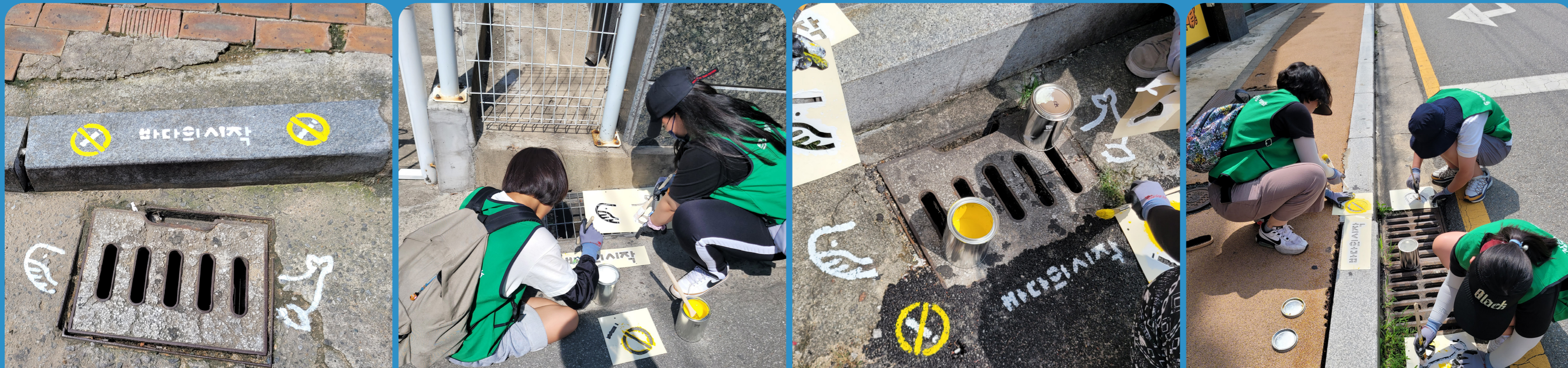
고래 이미지와 바다의 시작 문구를 새기면서 빗물받이가 바다의 시작이라는 것을 알리고 담배꽂초 이미지를 함께 그림으로써 담배꽂초투기를 방지하고자 함