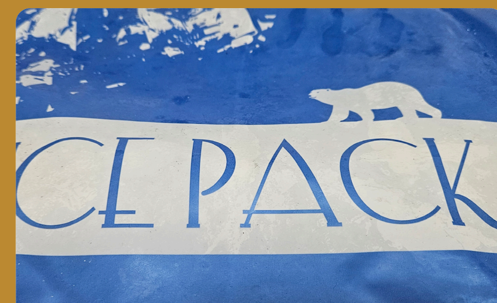
곳곳에서 다시 쓸 수 있는 아이스팩 재활용