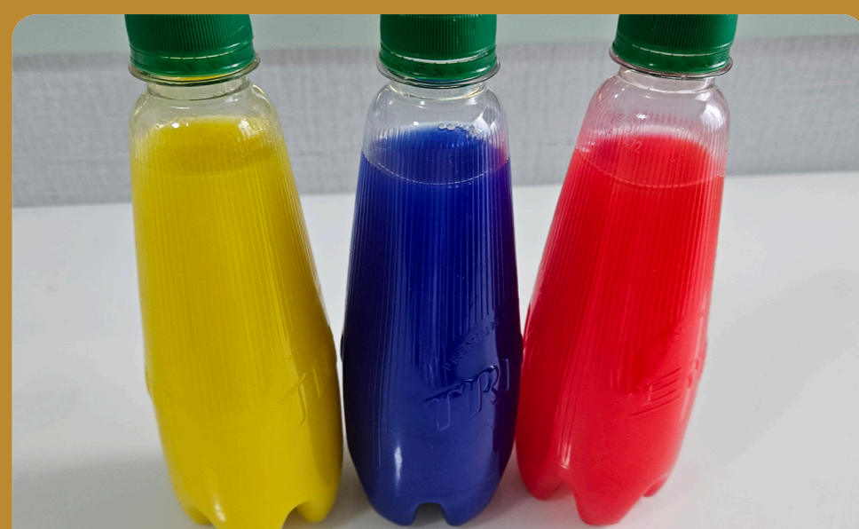
페트병을 운동기구로 재활용