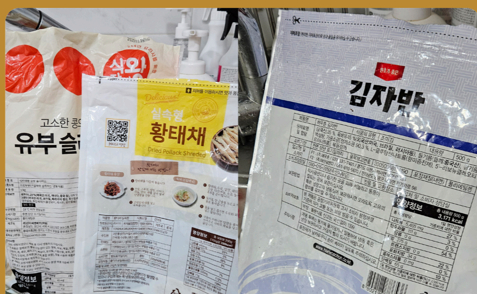
활용성이 좋은 튼튼한 비닐봉투 재활용