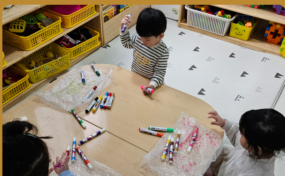
비닐포장재, 아이스팩 등을 스케치북으로 재활용