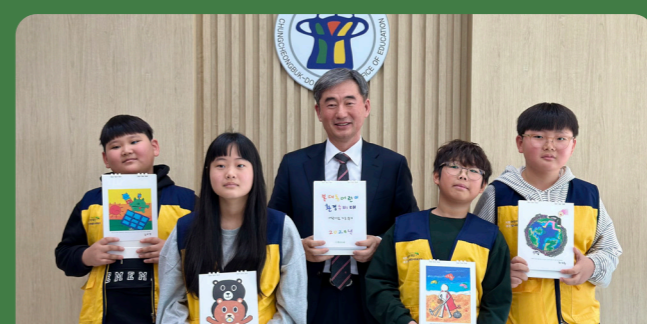
기후위기대응 캠페인 (달력제작 및 배포)