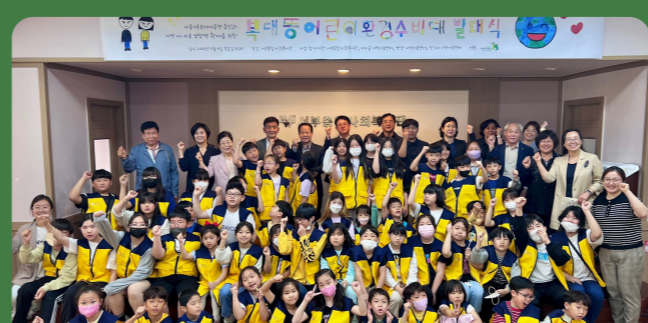
복대동 어린이 환경수비대 발대식