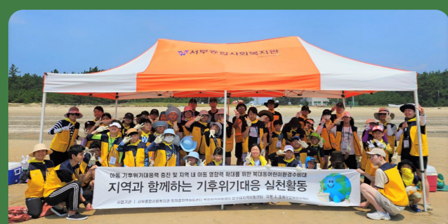
지역과 함께하는 기후위기대응 실천활동(비치코밍)