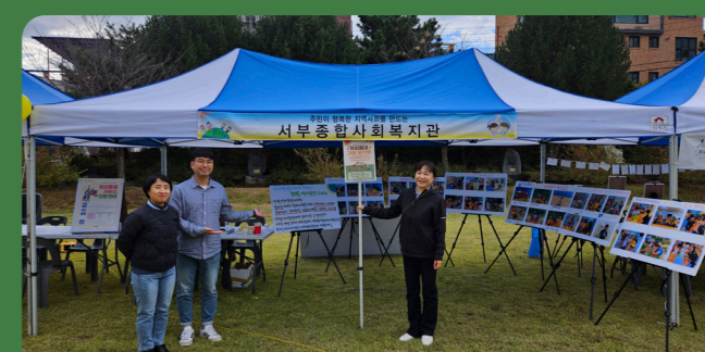
기후위기대응 캠페인 (한마음축제 사진전)