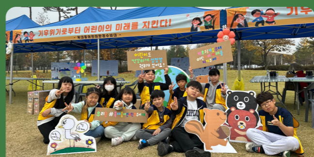
기후위기대응 캠페인 (아동권리축제)