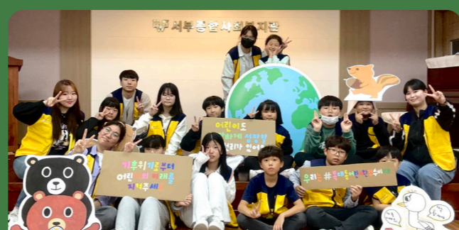
기후위기대응 캠페인 추진단 조직